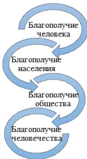
Рис. 1. Уровни исследования дефиниции «благополучие»

Суммируя эволюцию предмета изучения дефиниции «благополучие», следует выделить следующие уровни исследования этого понятия: благосостояние человека определяет благосостояние населения и общества, которые, в свою очередь, составляют в своей совокупности благополучие человечества в целом. Тесная взаимосвязь уровней благополучия можно схематически отразить на рисунке 1.