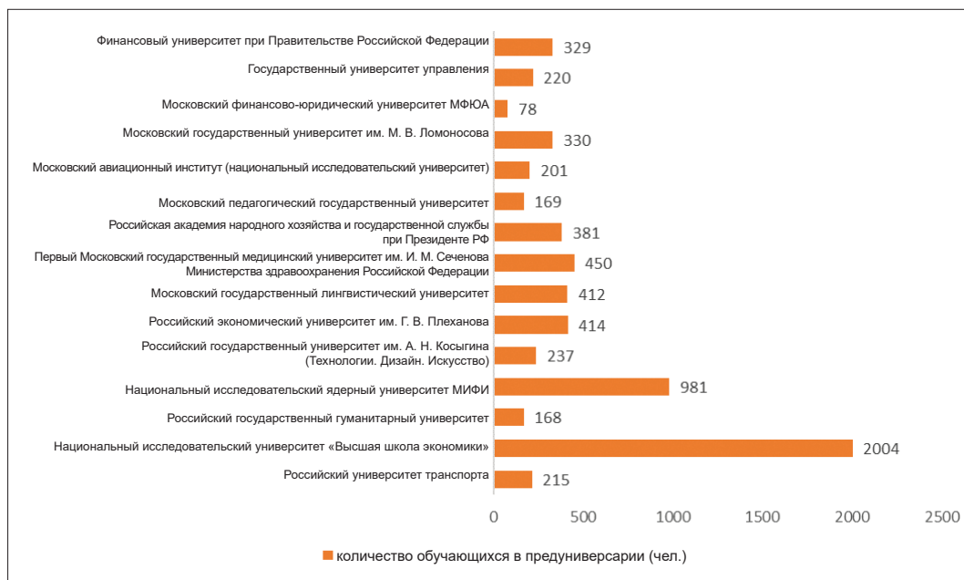
Рис. 2. Количество обучающихся в предвуниверсариях — участников пилотного проекта ДОНМ «Московский предвуниверсарий»

Финансовое обеспечение предвуниверсариев включает в себя элементы софинансирования: с одной стороны, финансирование идет за счет средств бюджета региона от ДОНМ, с другой — за счет средств университета. Конкретные площади для размещения закрепляются за предвуниверсарием приказом ректора, их использование регламентируется договором о безвозмездном пользовании зданий школ по согласованию с ДОНМ.