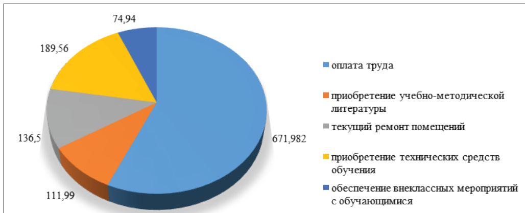
Рис. 1. Расходование средств, полученных от оказания платных образовательных услуг в 2021 году (тыс. руб.)

деятельности образовательного учреждения. Отметим, что полученных средств недостаточно для удовлетворения всех потребностей образовательного учреждения. Из этого следует необходимость поиска и разработки новых путей получения финансовых средств.