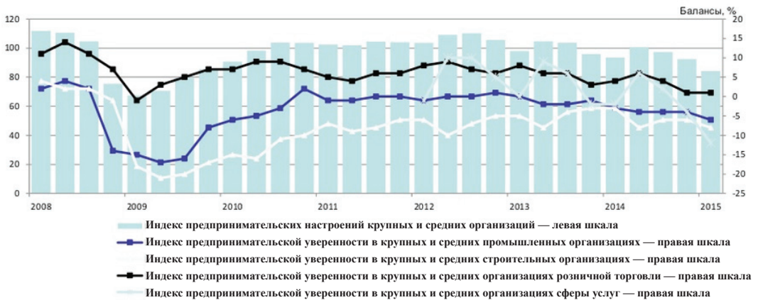
Рис. 1. Индекс предпринимательских настроений крупных и средних промышленных, строительных, торговых организациях и организациях сферы услуг 5

Что касается отношения самого бизнеса к антикризисным мерам, то оно совсем неоднозначное. «Почти половина предпринимателей в России (49 %) считает меры правительства по борьбе с кризисом неэффективными. Таковы результаты совместного опроса ВЦИОМа и Уполномоченного по правам предпринимателей. Он был проведен в феврале – марте 2015 г. среди 1644 бизнесменов во всех российских регионах» 4 . Общероссийская общественная организация «Деловая Россия» опубликовала последние данные по индексу предпринимательской уверенности (ИПУ) в разных сферах бизнеса. В первом квартале 2015 г. значение индекса приблизилось к значениям кризисного 2009 г. (рис. 1–2). В сфере услуг ИПУ продолжил снижение и достиг минимального значения за три года проведения обследований (–12 %).